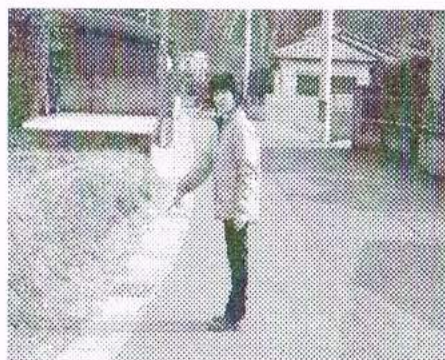
改修された集落内の側溝

車の転落事故も起こるなど「深くて危ない」との声が堀議員に寄せられました。自治会の方々とも協力して、市に改修を要請し、実現しました。